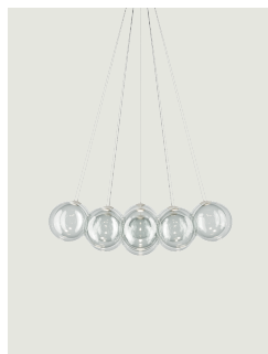
Random Cloud 14 Lights Ø28