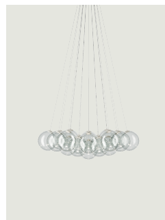
Random Cloud 19 Lights Ø23